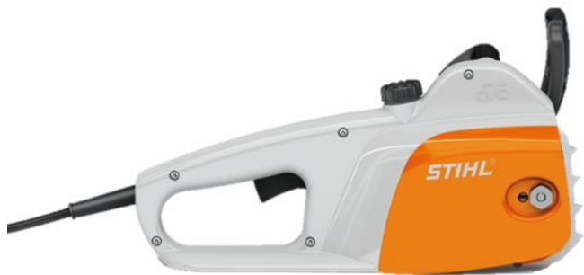
MSE 141 C