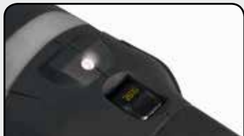
LED de surintensité moteur Overload LED light