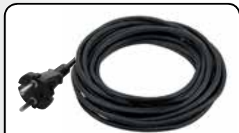
Câble 5 m résistant en caoutchouc Rubber 5 m power cord