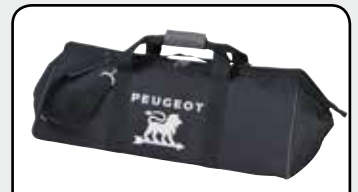
Livré en sac de transport Delivered in carrying bag