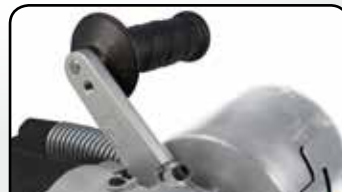
Poignée de maintien réglable Adjustable handle