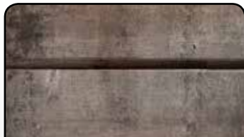
AVANT / BEFORE