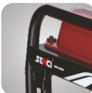
Cadru tratat pentru a preveni ruginirea