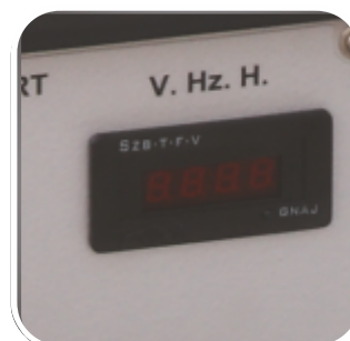
Contor ore, voltmetru si frecventa