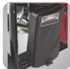
Filtru de aer patentat