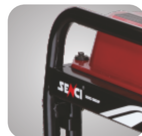
Cadru tratat pentru a preveni ruginirea