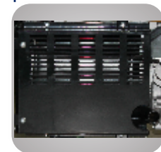
Esapament unic ce reduce zgomotul