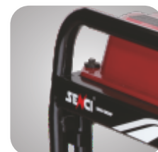
Cadru tratat pentru a preveni ruginirea