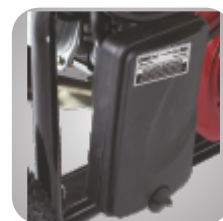
Filtru de aer patentat