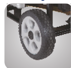
Kit roti si manere