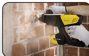
Technologie Brushless Brushless technology