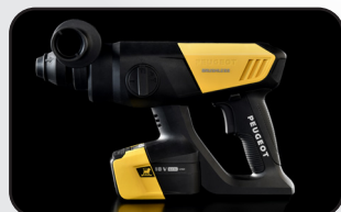
Poignée ergonomique bimatière Ergonomic bimaterial handle

The BRUSHLESS technology is : - more work autonomy - more engine longevity - less maintenance