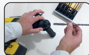
Mandrin SDS + SDS + chuck