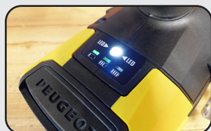
Éclairage LED de la zone de travail LED light of the working area