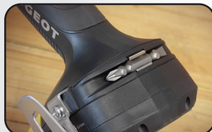
Embout de vissage double FE2/PH2 Double screw bits FE2/PH2