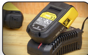
Chargeur rapide : temps de charge 45 min Fast charger : charging time 45 min