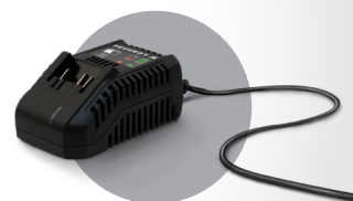
Livrée avec chargeur Charger included

DESIGNED IN FRANCE BY PEUGEOT DESIGN LAB