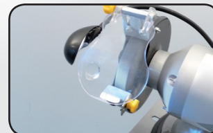
Éclairage LED orientable Adjustable LED light