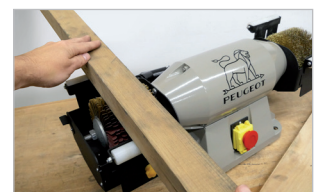
Travail précis en appui Stationary work for more accuracy