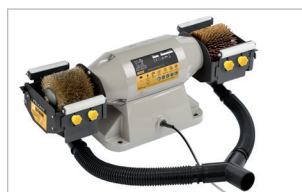
tubes et connexion en Y pour aspirateur fournis tubes and Y-connection for vacuum supplied