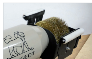
Plusieurs modèles de brosses disponibles Several brush models available